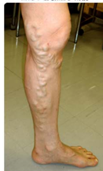
日帰り静脈瘤手術前